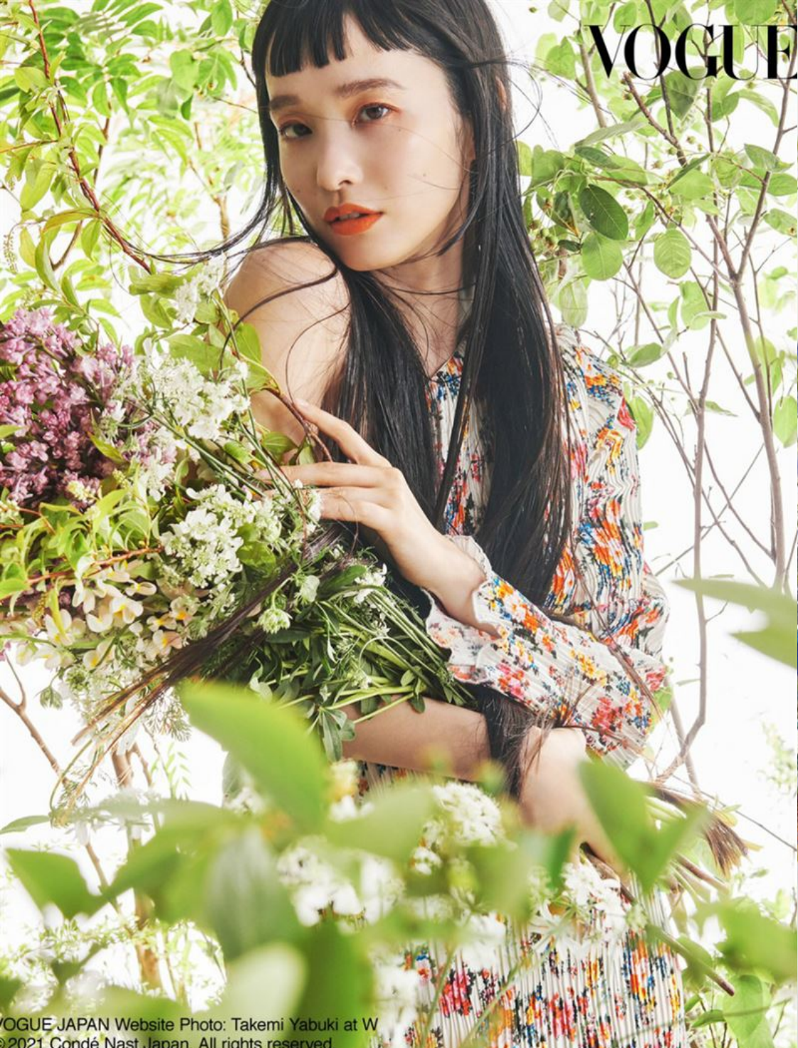
VOGUE JAPAN Website