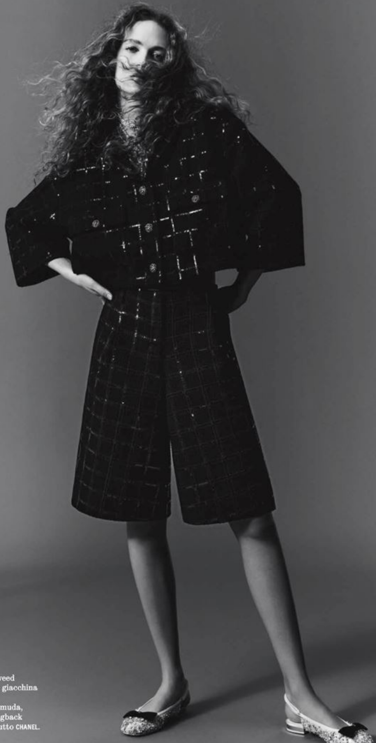
Tailleur di tweed composto da giacchina con bottoni gioiello e bermuda, collane e slingback con fiocco. Tutto CHANEL.