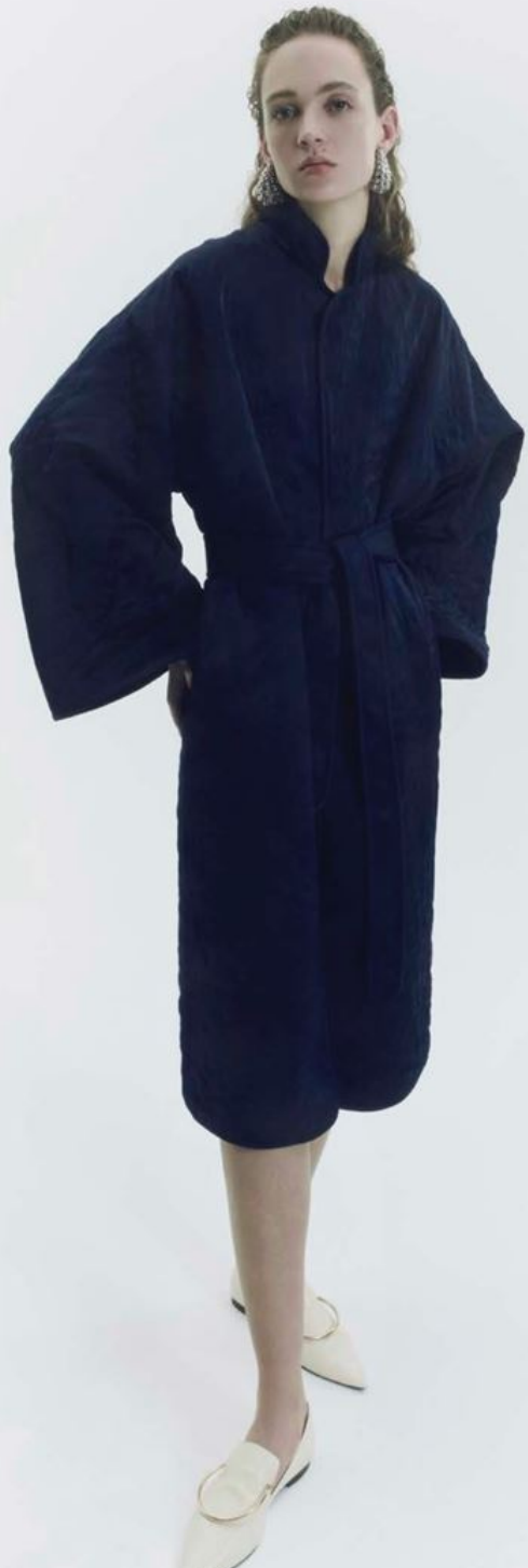
Coat a kimono in cashmere, LORO PIANA. Macro orecchini a cerchio, VALENTINO GARAVANI. Mocassini affusolati, CALCATERRA.