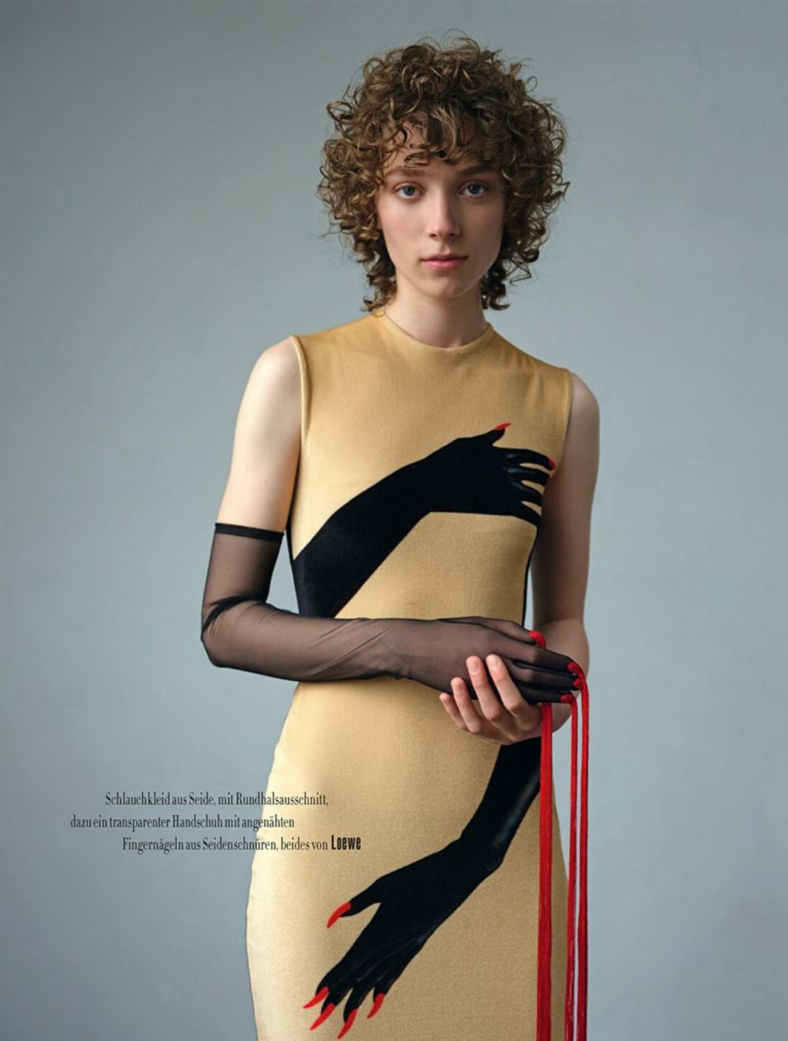
Schlauchkleid aus Seide, mit Rundhalsausschnitt, dazu ein transparenter Handschuh mit angenähten Fingernägeln aus Seidenschnüren, beides von Loewe