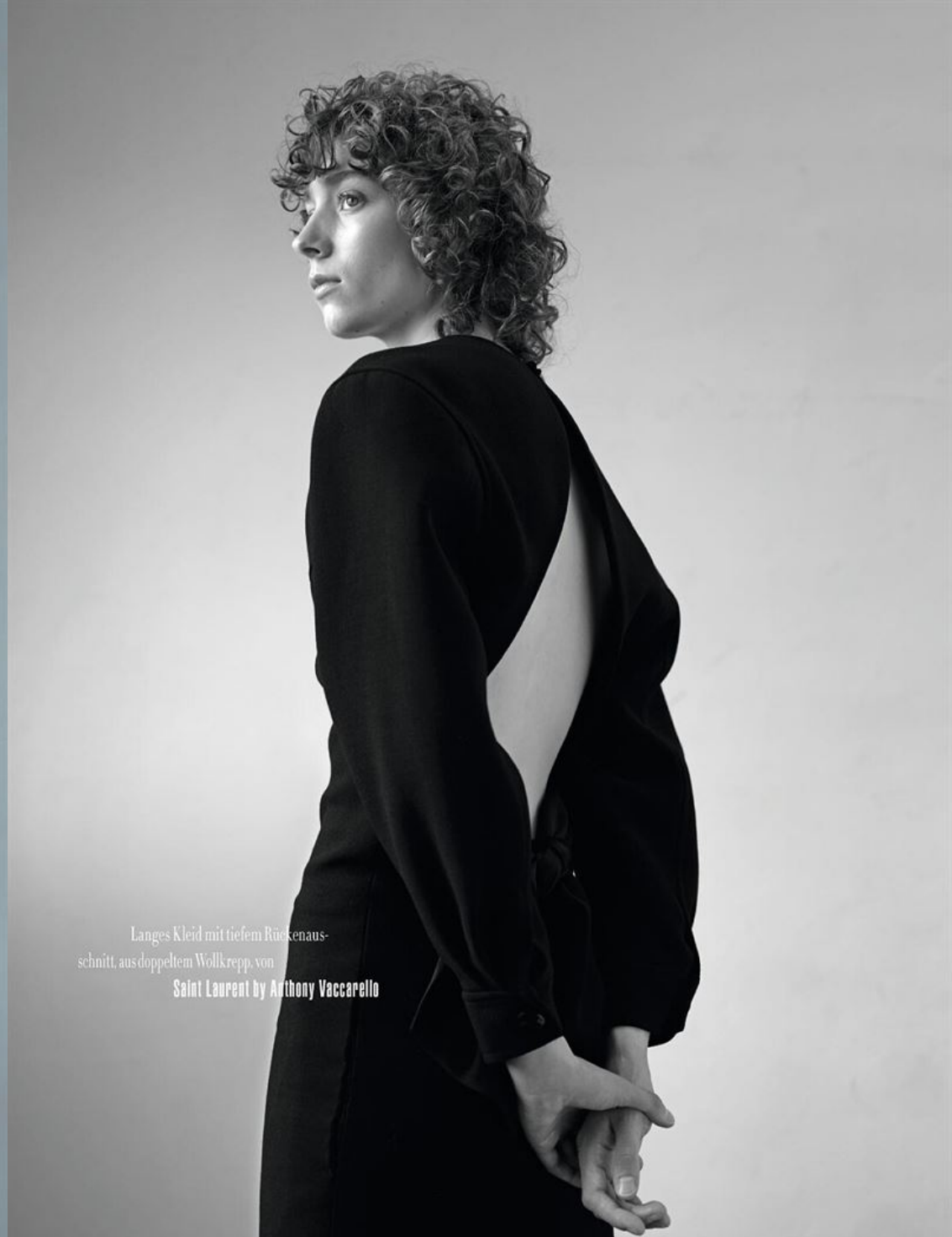
Langes Kleid mit tiefem Rückenausschnitt, aus doppeltem Wollkrepp, von Saint Laurent by Anthony Vaccarello