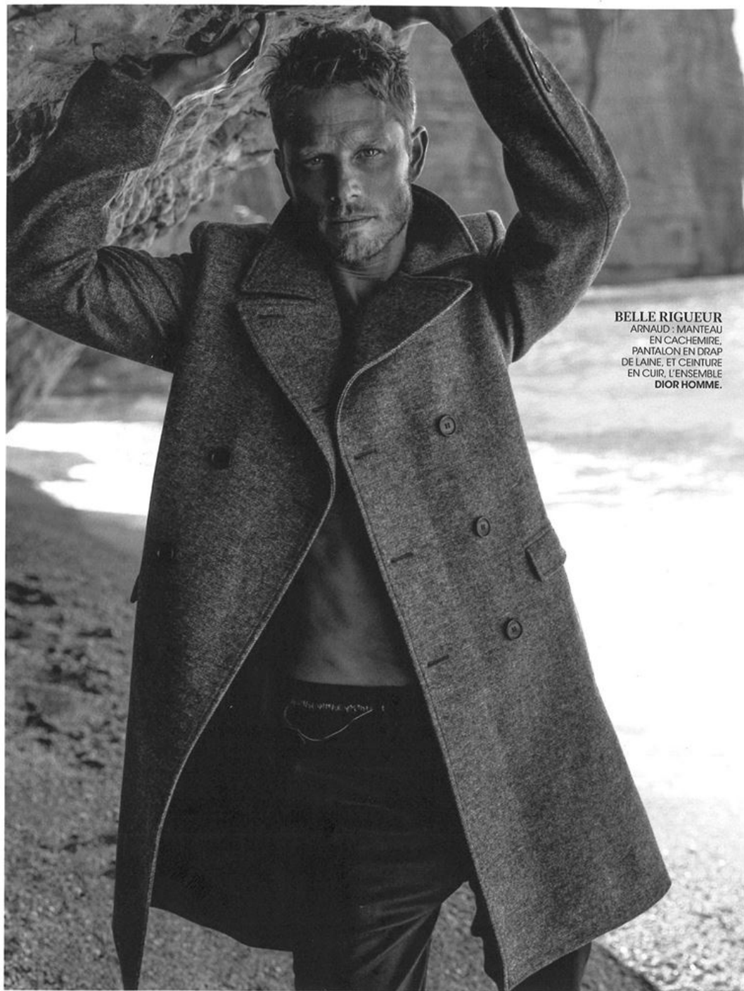
BELLE RIGUEUR ARNAUD : MANTEAU EN CACHEMIRE, PANTALON EN DRAP DE LAINE, ET CEINTURE EN CUIR, L'ENSEMBLE DIOR HOMME.