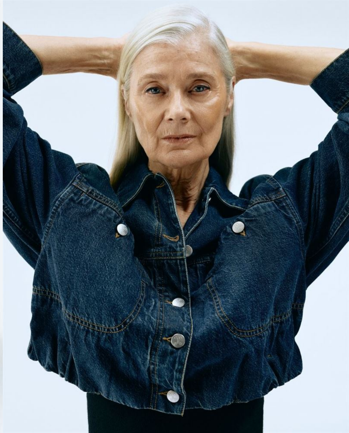
Veste, pantalon et chaussures LOEWE