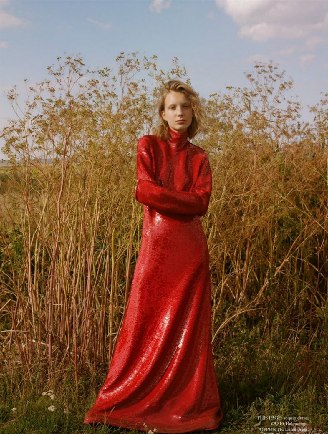
THIS PAGE: sequin dress, £5,310, Balenciaga. OPPOSITE: latex dress