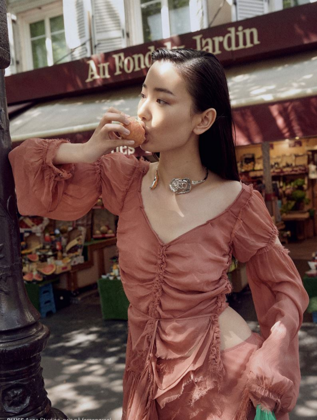
COLE Giambattista Valli, 33 834 kr. KO Jimmy Choo, 9 920 kr.