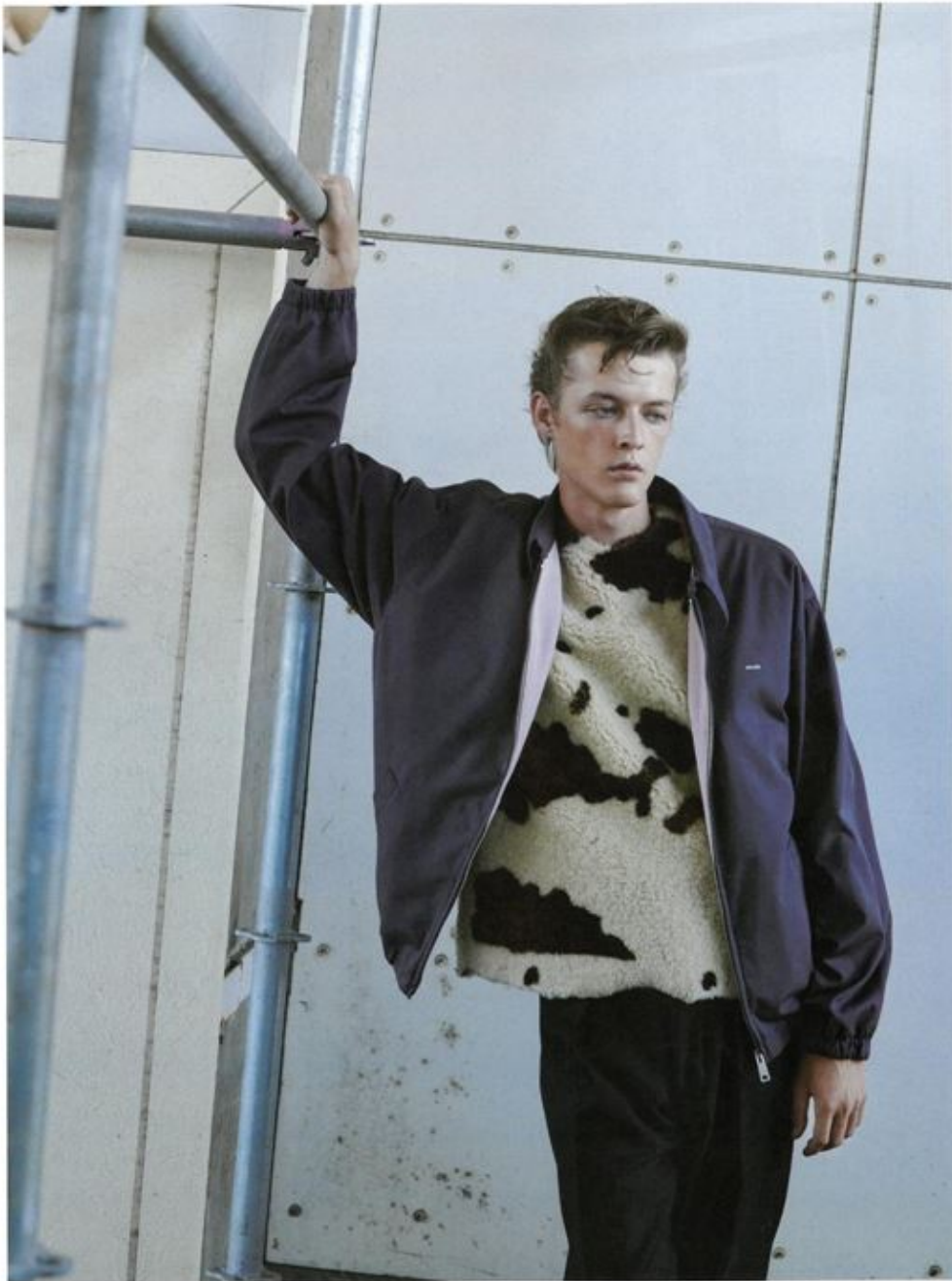
まず目を奪われるのが、シアリングで仕立てたベスト。無造作なカッチャングによるシアリング使いは、異いにおける原始的な運動性をもつものとして、今季のブラダに欠かせない。スポーティなコットンジャケットとのコントラストを極めたい。ジャケット ¥357,500、ベスト ¥616,000、パンツ ¥308,000/すべてブラダ(ブラダ クライアントサービス) ※すべて予定価格