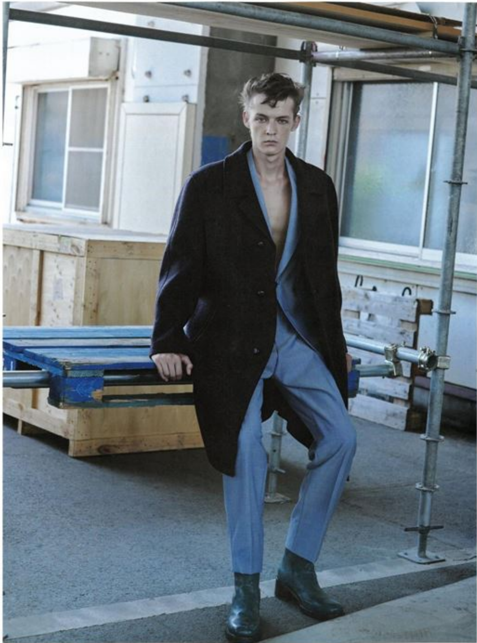
メリッドな質感を漂えたモヘア調のスーツは、クリーンな色めとボウシーなシルエットが連続された印象。チーリングを駆使したツツレザーの包みボタンを配すなど、細部にこだわったウールコートのボリュームを活かして。コート ¥803,000、ジャケット ¥627,000、パンツ ¥280,500、ブーツ ¥291,500/すべてブラダ(ブラダ クライアントサービス) ※すべて予定価格