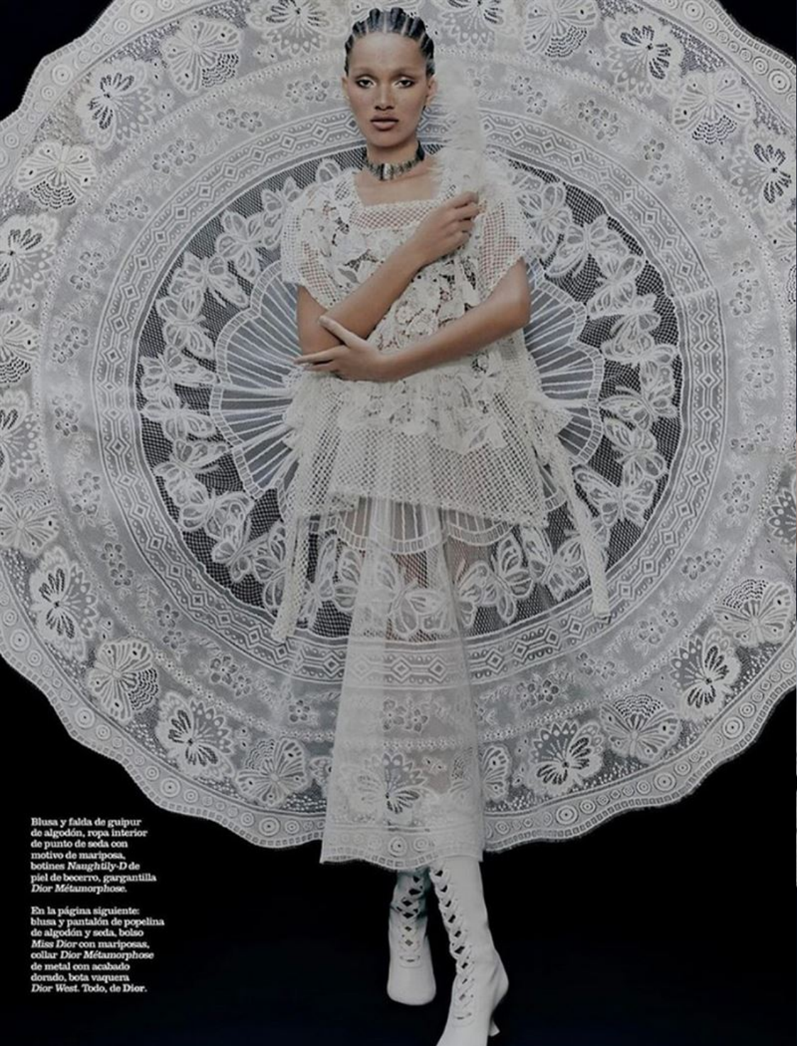
Blusa y falda de guipur de algodón, ropa interior de punto de seda con motivo de mariposa, botinas Naughtily-D de piel de becerro, gargantilla Dior Métamorphose .