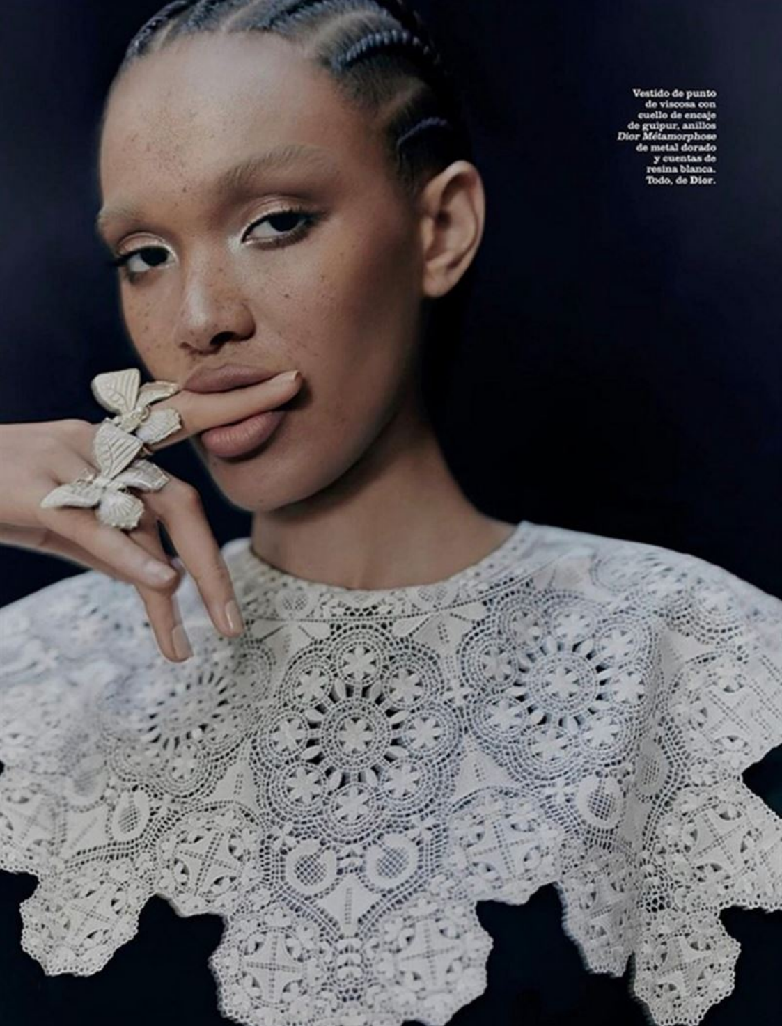
Vestido de punto de viscosa con cuello de encaje de guipur, anillos Dior Métamorphose de metal dorado y cuentas de resina blanca. Todo, de Dior.