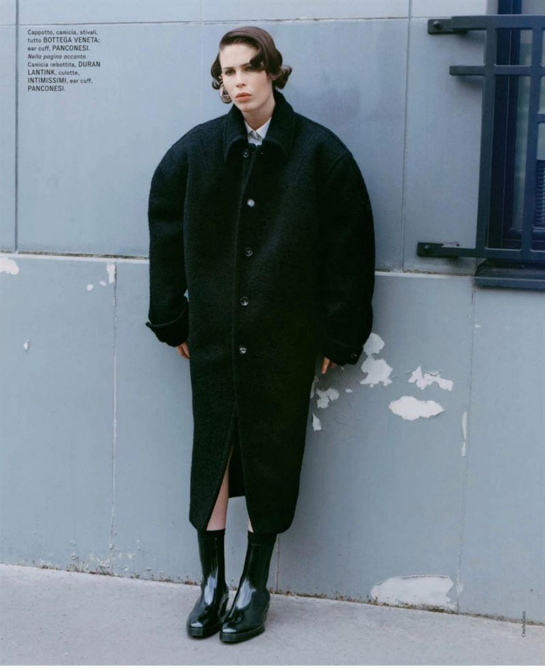
Cappotto, camicia, stivali, tutto BOTTEGA VENETA ; ear cuff, PANCONESI . Nella pagina accanto: Camicia imbottita, DURAN , LANTINK , culotte, INTIMISSIMI , ear cuff, PANCONESI .