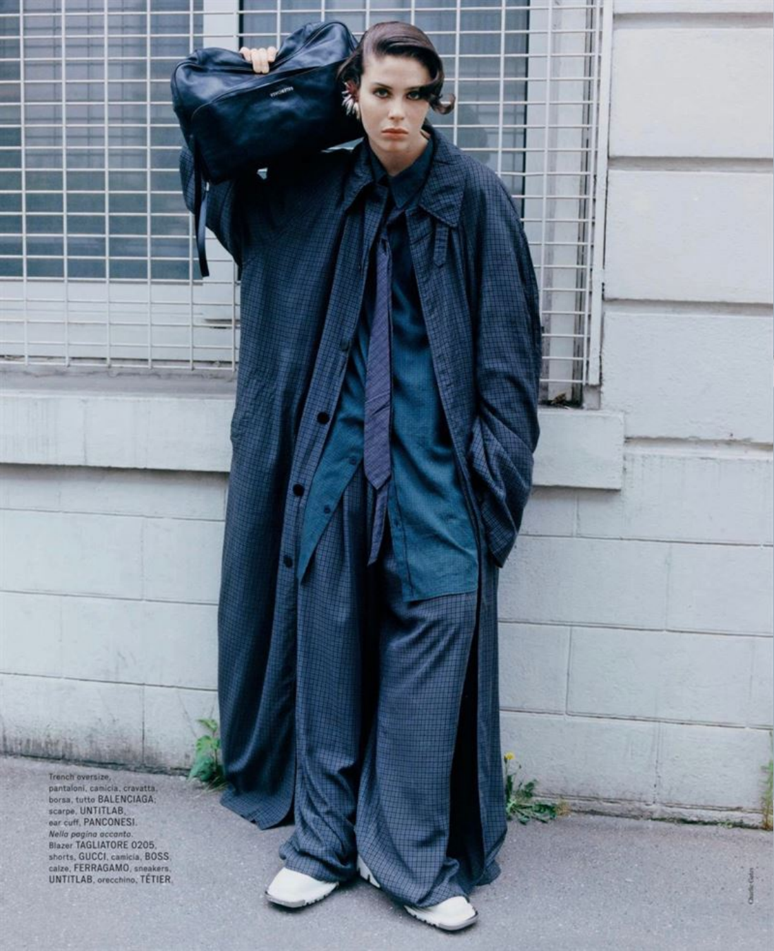
Trench oversize, pantaloni, camicia, cravatta, borsa, tutto BALENCIAGA . scarpe, UNTITLAB , ear cuff, PANCONESI . Nella pagina accanto: Blazer TAGLIATORE 0205 , shorts, GUCCI , camicia, BOSS , calze, FERRAGAMO , sneakers, UNTITLAB , orecchino, TÉTIER .