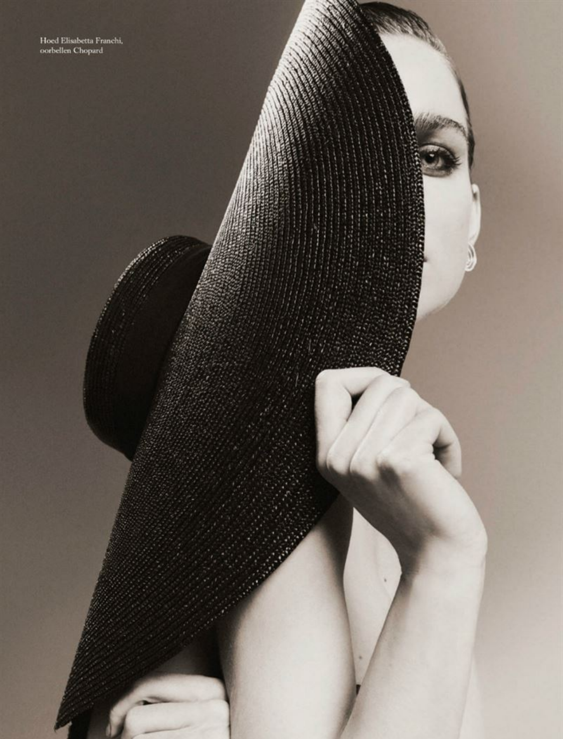
Hoed Elisabetta Franchi, oorbellen Chopard