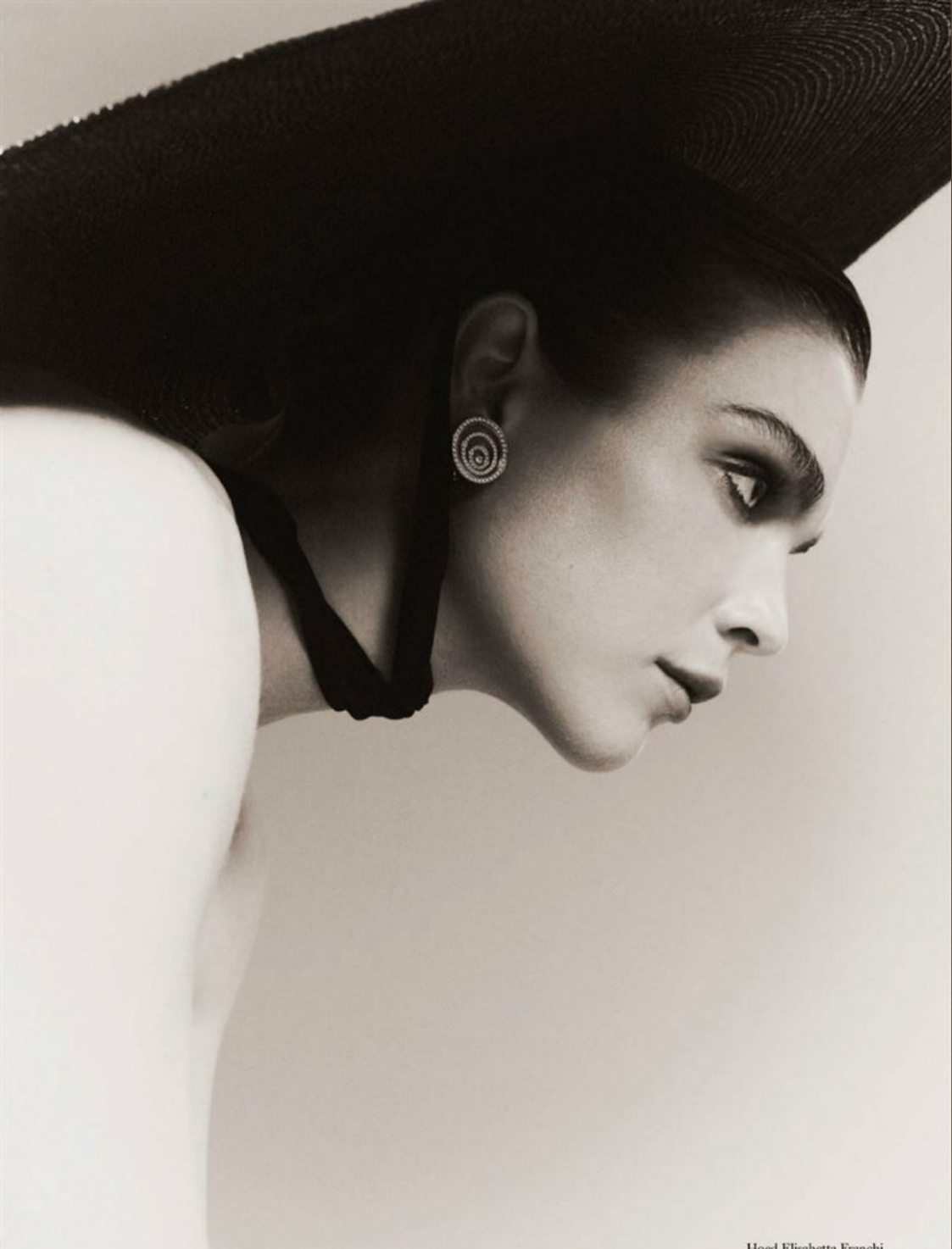
Hoed Elisabetta Franchi