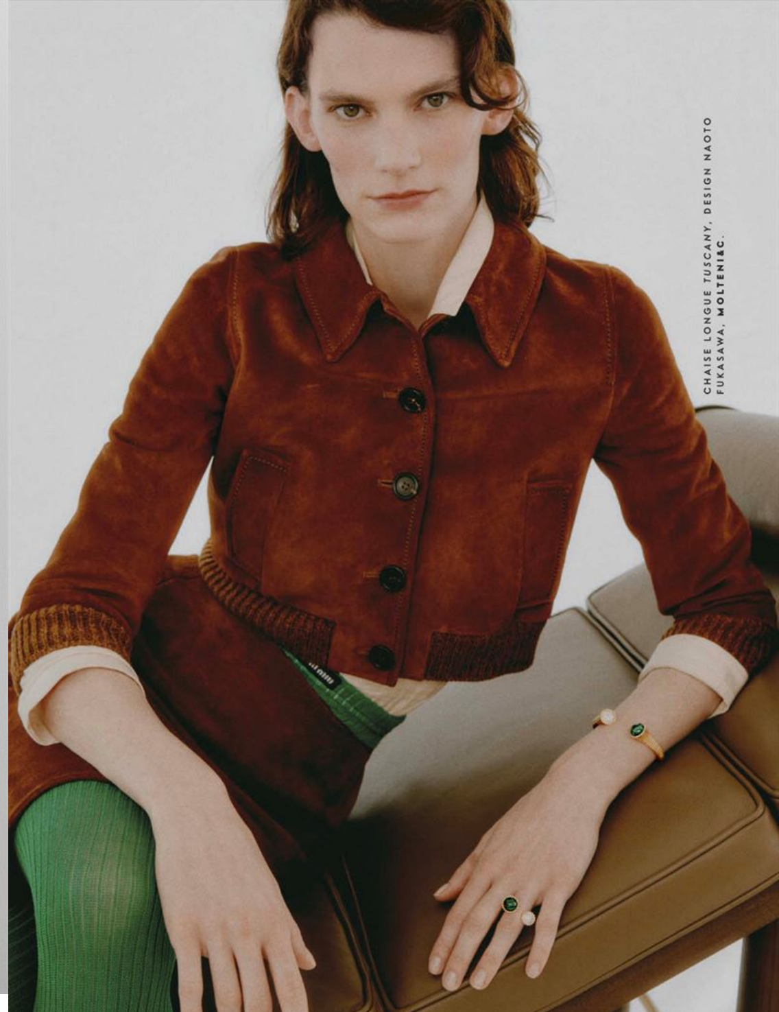
CHAISE LONGUE TUSCANY, DESIGN NAOTO FUKASAWA, MOLteni&c.