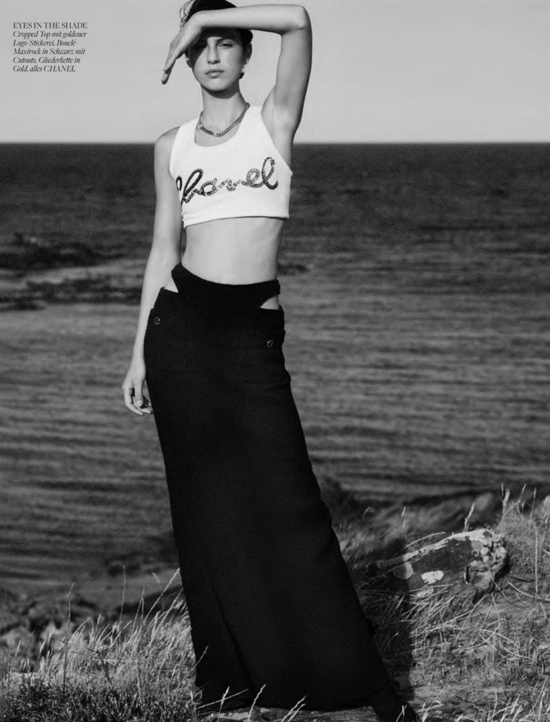
EYES IN THE SHADE Cropped Top mit goldener Logo-Stickerei, Bouclé- Maxirock in Schwarz mit Cutouts, Gliederkette in Gold, alles CHANEL