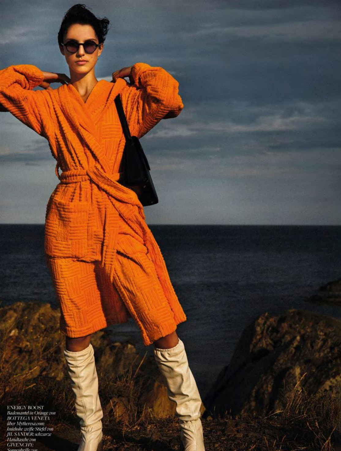
ENERGY BOOST Bademantel in Orange von BOTTEGA VENETA über Mytheresa.com knöchelhohe weiße Stiefel von JIL SANDER, schwarze Handtasche von GIVENCHY, Sonnenschutzbrille von