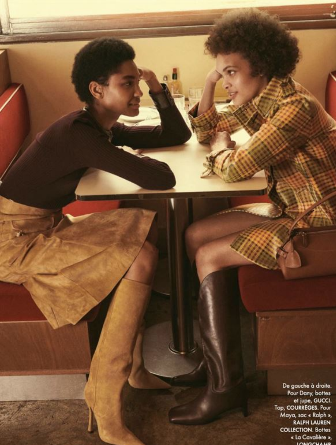
De gauche à droite. Pour Dany, bottes et jupe, GUCCI. Top, COURRÈGES. Pour Maya, sac « Ralph », RALPH LAUREN COLLECTION. Bottes « La Cavalière », LONGCHAMP