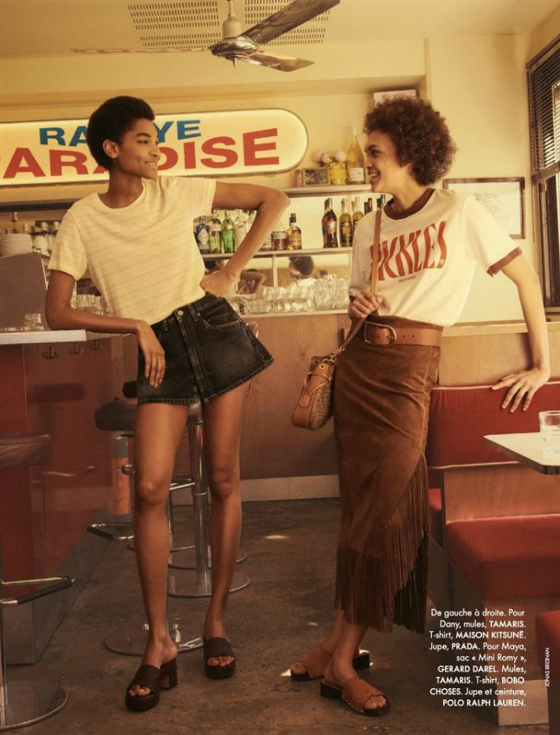
De gauche à droite. Pour Dany, mules, TAMARIS. T-shirt, MAISON KITSUNE. Jupe, PRADA. Pour Maya, sac « Mini Romy », GERARD DAREL. Mules, TAMARIS. T-shirt, BOBO CHOSES. Jupe et ceinture, POLO RALPH LAUREN.