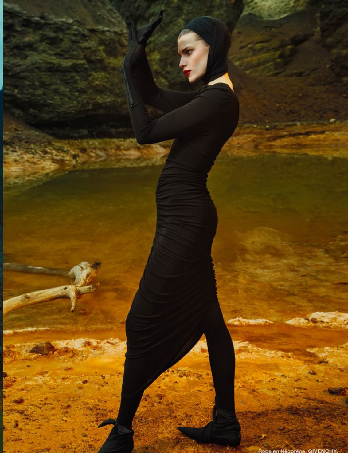
Robe en Néoprène, GIVENCHY.