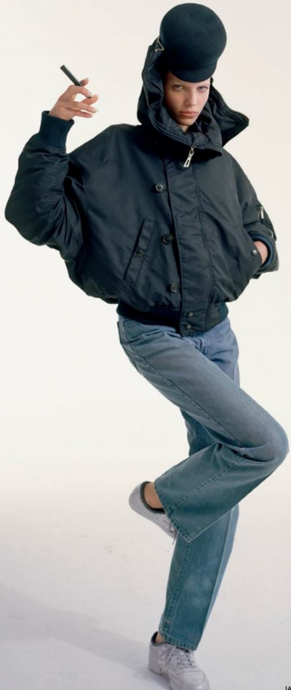
JACKET V/PROJECT JEANS VINTAGE LEVI'S