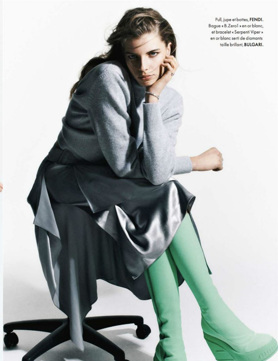
Pull, jupe et bottes, FENDI . Bague « B.Zero1 » en or blanc, et bracelet « Serpenti Viper » en or blanc serti de diamants taille brillant, BULGARI .