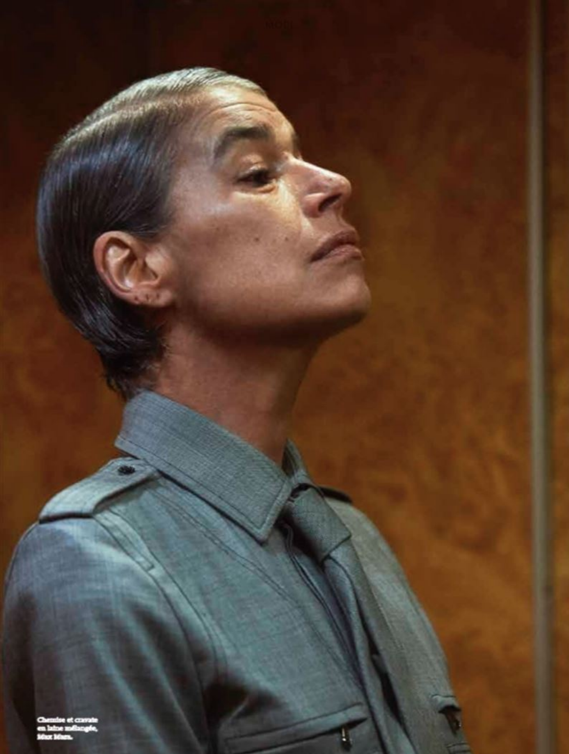
Chemise et cravate en laine mérinos, filé fin.