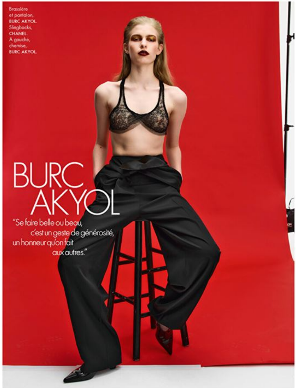
Brassière et pantalon, BURC AKYOL. Slingbacks, CHANEL. À gauche, chemise, BURC AKYOL.