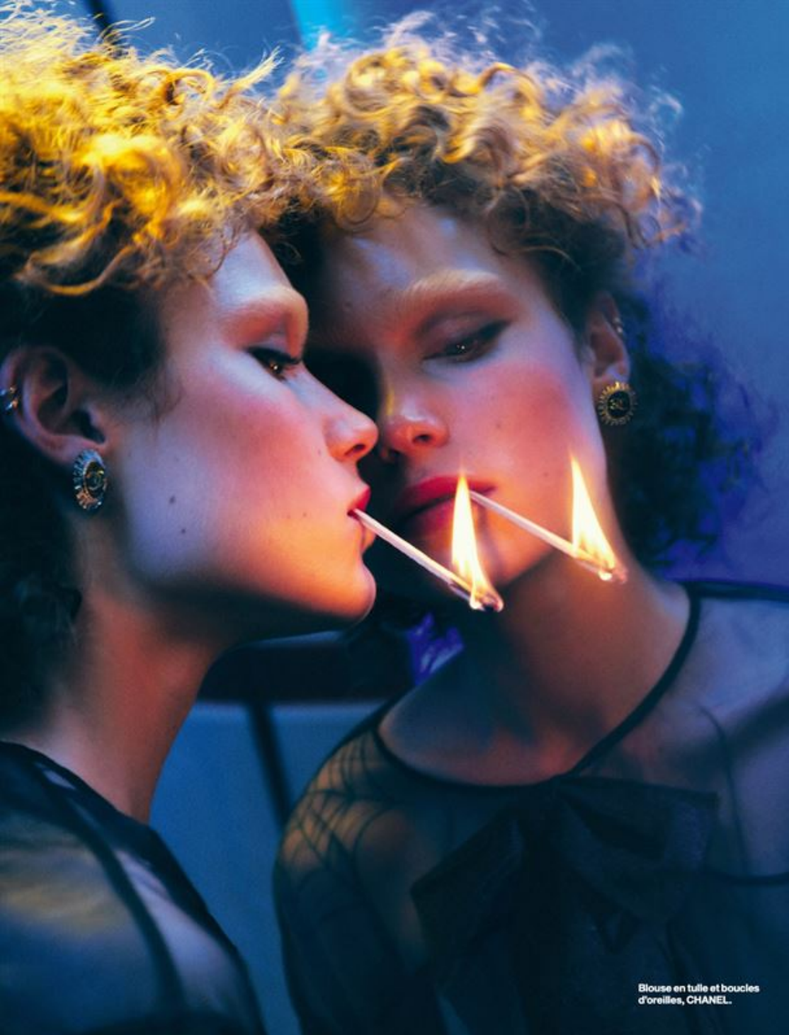
Blouse en tulle et boucles d'oreilles, CHANEL.