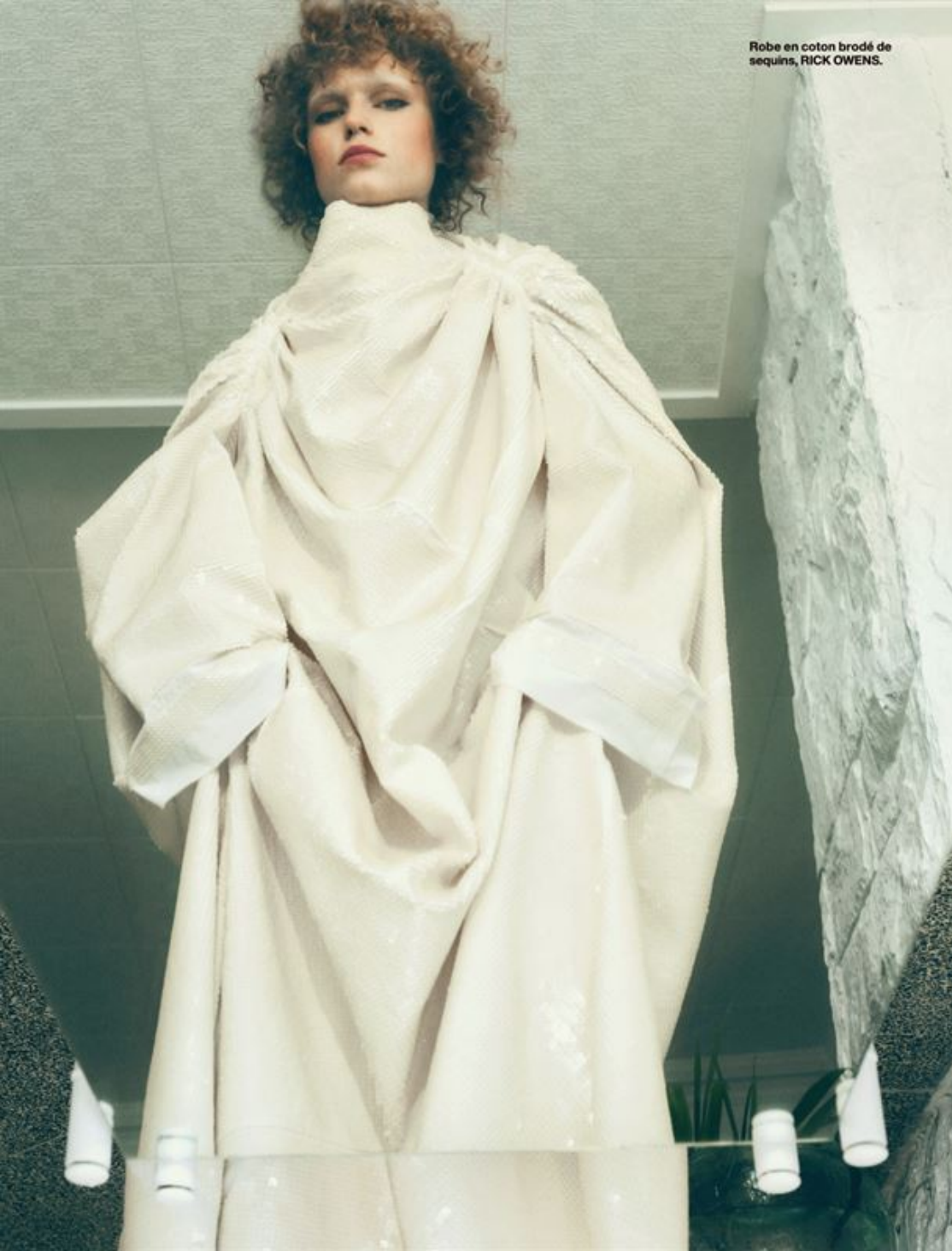
Robe en coton brodé de sequins, RICK OWENS.